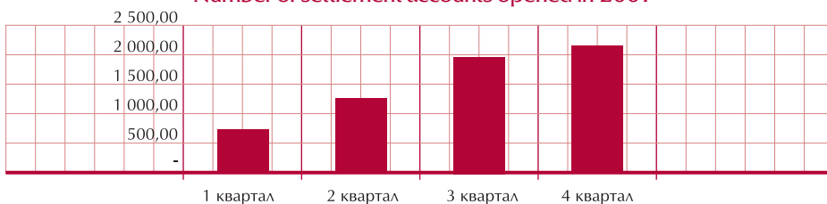
КОЛИЧЕСТВО РАСЧЕТНЫХ СЧЕТОВ ОТКРЫТЫХ В 2007 Г. Number of settlement accounts opened in 2007

Социальная значимость бизнеса имеет приоритетное значение в деятельности Банка, поэтому в прошедшем году банк принимал активное участие в реализации федеральных национальных проектов.